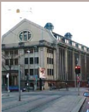
Rue Gustave Adolphe Hirn