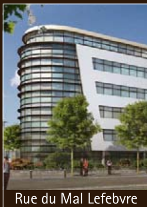
Rue du Mal Lefebvre

500 à 6.098 m 2 A louer Livraison : septembre 2008 Architecte : J. Bouyneau Projet Foncière Artéa