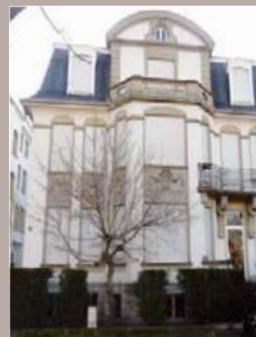
Quai Rouget de l'Isle

2.718,40 m 2 A louer Livraison : 2 ème semestre 2008 Architecte : A. Schwab