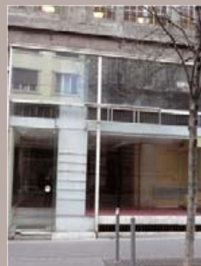
R. du Vieux Marché aux Vins

Commerce libre d'occupation. RdC : 76 m 2 Premier étage : 75 m 2 Sous-sol : 75 m 2