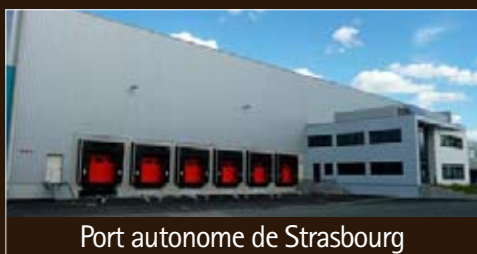
Port autonome de Strasbourg

1.200 m 2 divisibles - A louer Livraison : octobre 2009