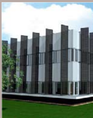
Aéroparc - Entzheim

Immeuble neuf de qualité. Proximité aéroport. Proximité autoroute. Nombreux parkings.